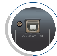
Interfaz de comunicación USB